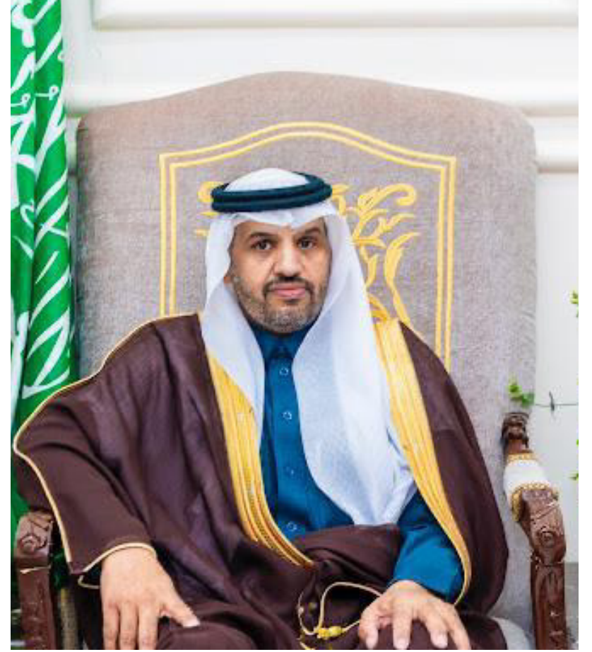
محافظ ضريه نادر بن فهاد آل نادر